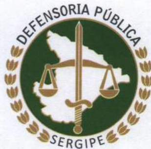
TABELA DE ATUAÇÃO DO PETICIONAMENTO INTEGRADO

O peticionamento será realizado em todas as Comarcas do Estado, apesar da ausência de Defensores Públicos lotados em algumas unidades